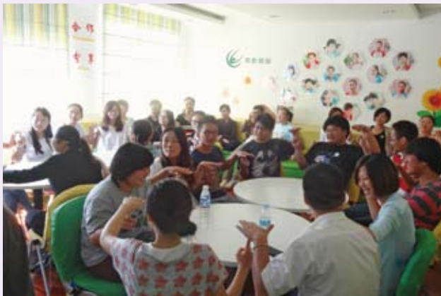
▲ 9月8日，上海市计生协举办青春健康青年网络活动