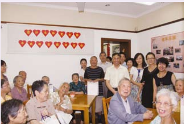
▲ 9月17日，上海市计生协党支部开展中秋慰问助老活动