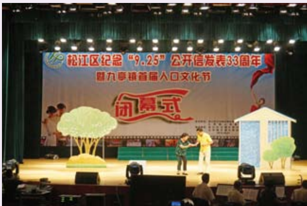
▲ 9月24日，松江区举行纪念“9.25”暨九亭镇首届人口文化节活动