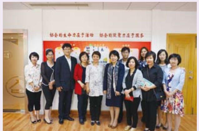
▲ 10月11日，上海市计生协接待韩国人口保健福利协会一行来访