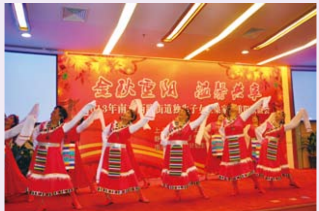
▲ 10月11日，静安区计生协和南京西路街道计生协联合举办的“金秋重阳 温馨共享”——独生子女空巢家庭重阳联谊会