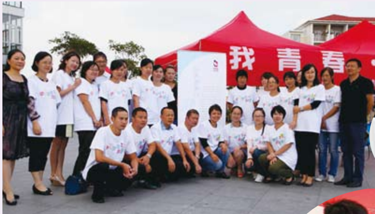
▲ 9月26日，上海市计生协举办“世界避孕日”宣传服务活动