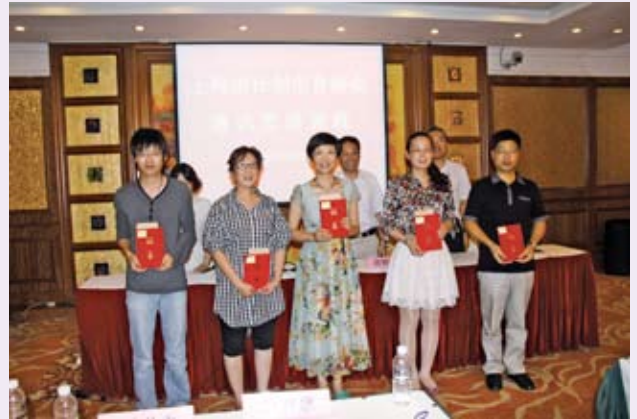
▲ 9月12日，上海市计生协举办宣传通讯员培训班