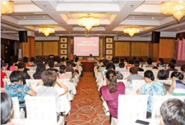
▲ 9月12-13日，上海市计生协秘书处举办上海市人口计生群众自治示范村（居）培训班