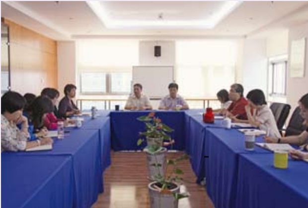
▲ 9月27日，上海市计生协党支部召开党的群众路线教育实践活动专题学习交流会