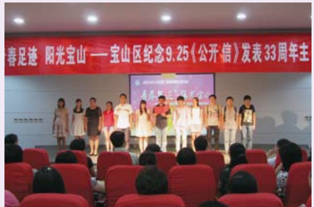
▲ 9月24日，宝山区举行“青春足迹 阳光宝山”纪念“9.25”《公开信》发表33周年主题活动