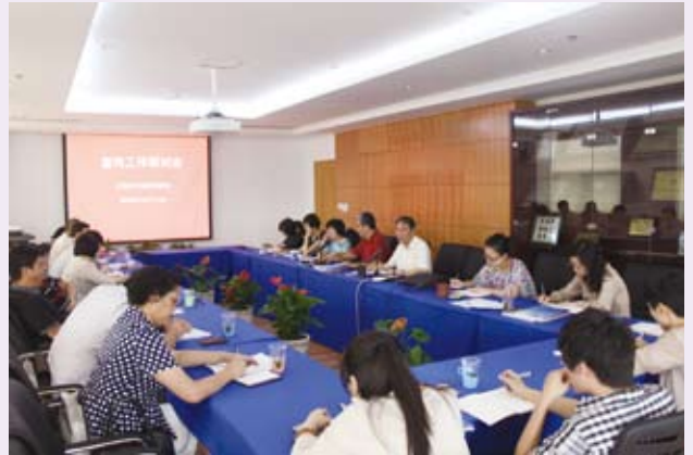
▲ 10月14日，上海市计生协召开宣传工作研讨会