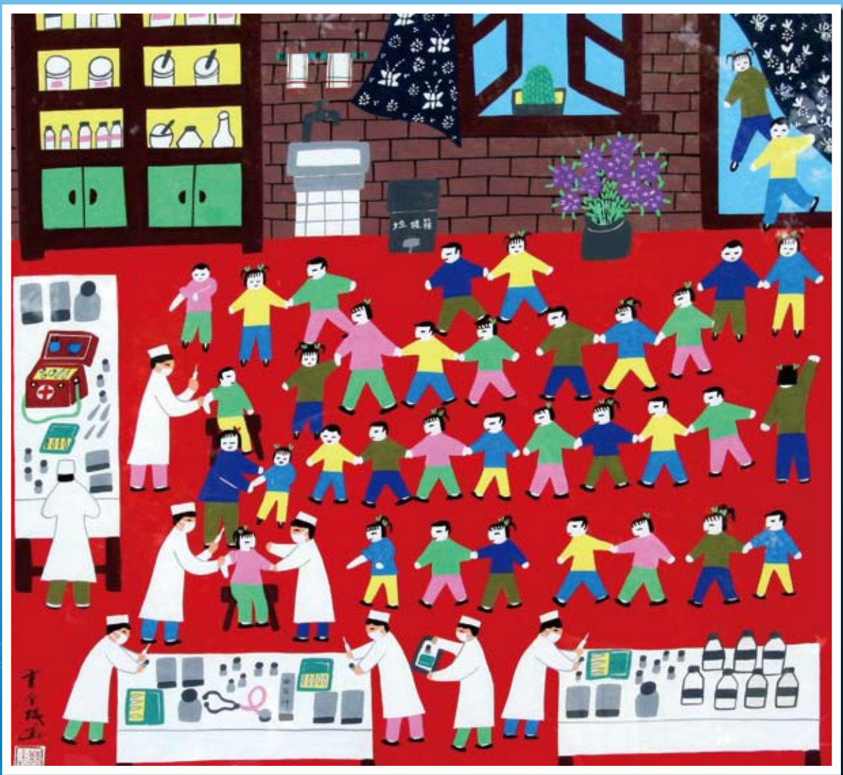
降低出生缺陷 提高人口素质 作者：曹金根