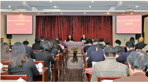
▲ 11月19—20日，上海市计生协举办纪念成立30周年专题研修班