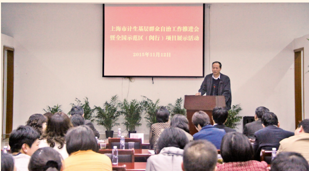
▲ 11月12日，上海市计生协在闵行区华漕镇王泥浜村举办基层群众自治工作推进会暨中国计生协示范区项目现场交流活动