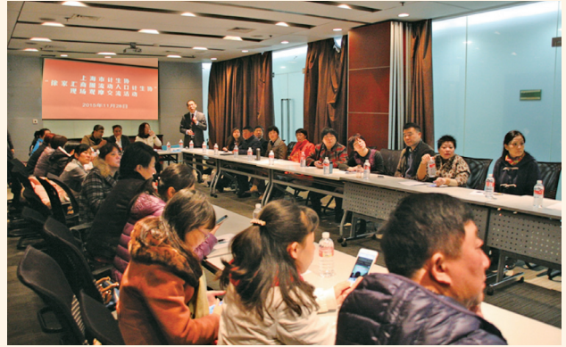
▲ 11月28日，上海市计生协在美罗商城举办“徐家汇商圈流动人口计生协”现场观摩交流活动