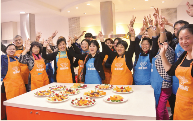
▲ 10月29日，上海市计生协和上海市人口和家庭计划指导服务中心在虹口区欧阳街道社区生活服务中心举办“健康厨房社区行”活动