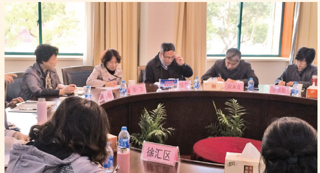
▲ 11月10日，上海市计生协召开座谈会，讨论谋划2016年协会工作