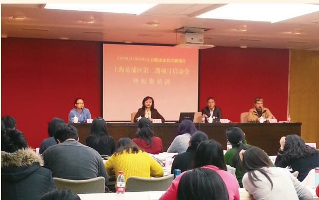
▲ 12月11日，黄浦区计生协召开“中国计生协/联合国教科文组织青春健康家长培训项目”第二期启动会暨师资培训