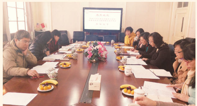
▲ 12月18日，中国计生协/联合国教科文组织项目官员来沪调研黄浦区青春健康家长培训项目