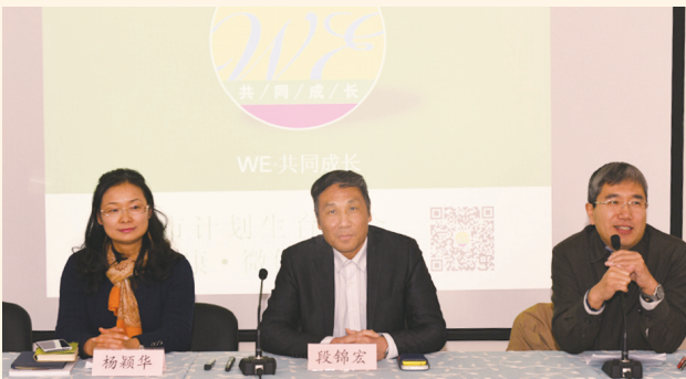
▲ 12月17日，上海市计生协开通“WE·共同成长”青春健康微信公众平台