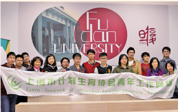
▲ 12月1日，上海市青春健康青年工作网络成员在复旦大学开展“世界艾滋病日”宣传活动