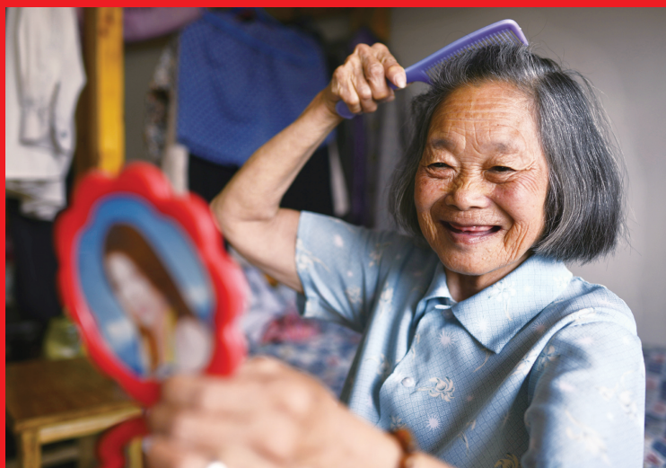
▲ 敬老院里的新生活 （作者：徐泾镇 张友明）