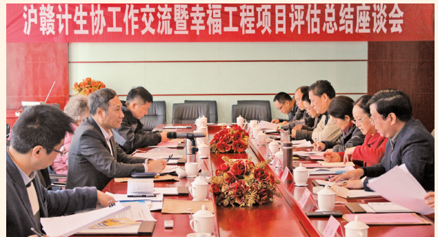
▲ 11月24—26日，上海市计生协、幸福工程上海市组委会办公室与上海映绿公益事业发展中心一行赴江西开展幸福工程异地援助项目评估