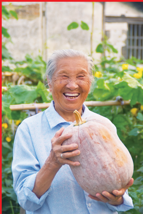
▲ 知足 （作者：金泽镇 金伊丽）