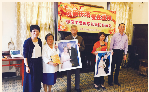
▲ 10月20日，静安区南西街道计生协举办“健康乐活爱在重阳”——馨风关爱俱乐部重阳联谊会