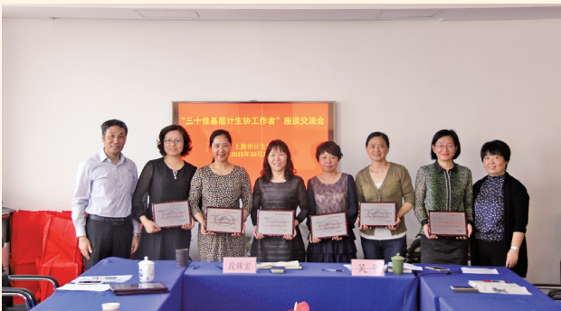
▲ 10月22日，上海市计生协召开“三十佳基层计生协工作者”座谈会