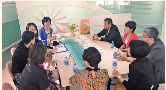
▲ 10月21—22日，中国计生协青春健康项目调研组对上海市社区青少年生殖健康促进项目和青春健康俱乐部建设进行考察评估